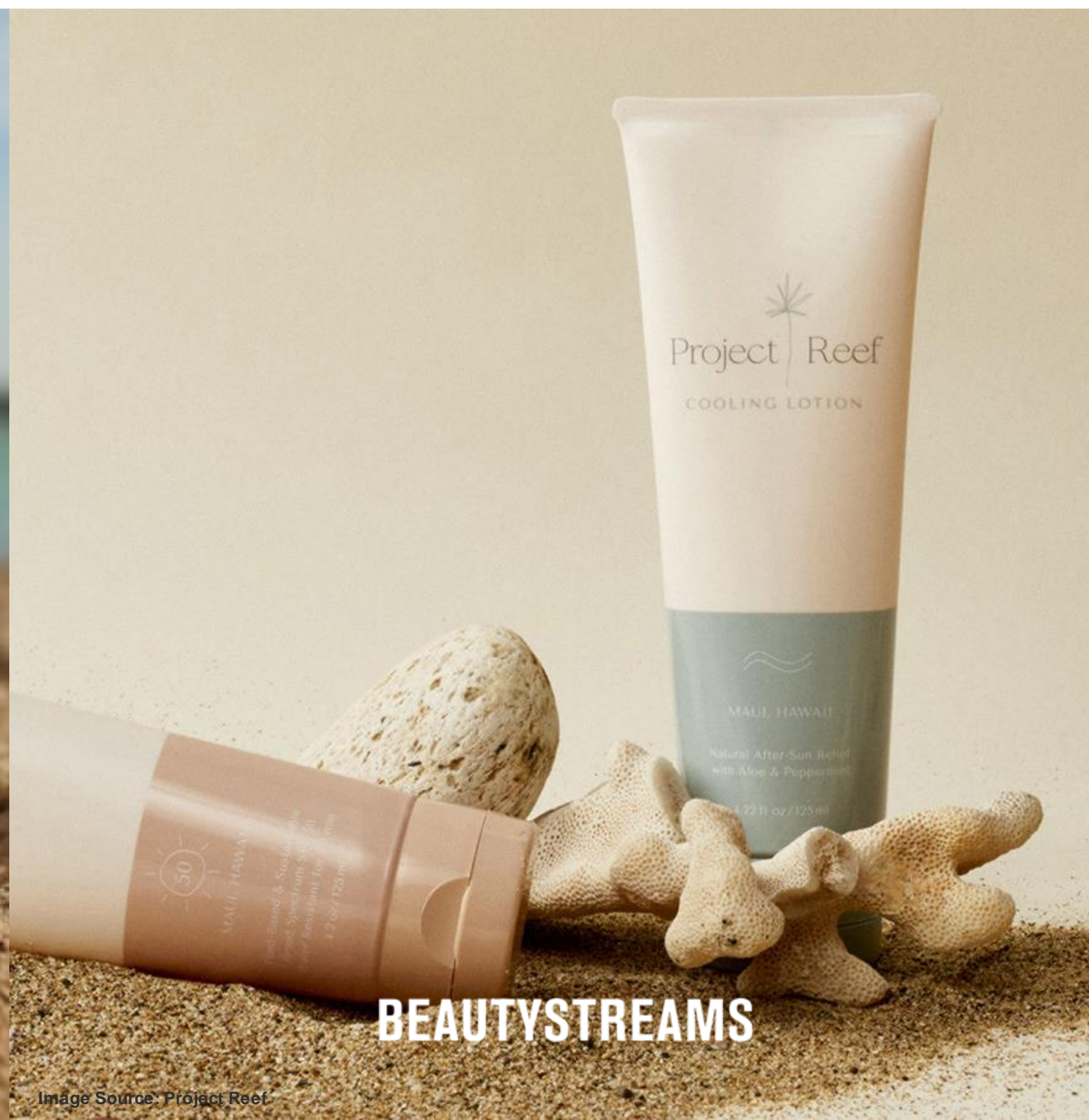
PROJECT REEF - HAWAII Sustainable Suncare