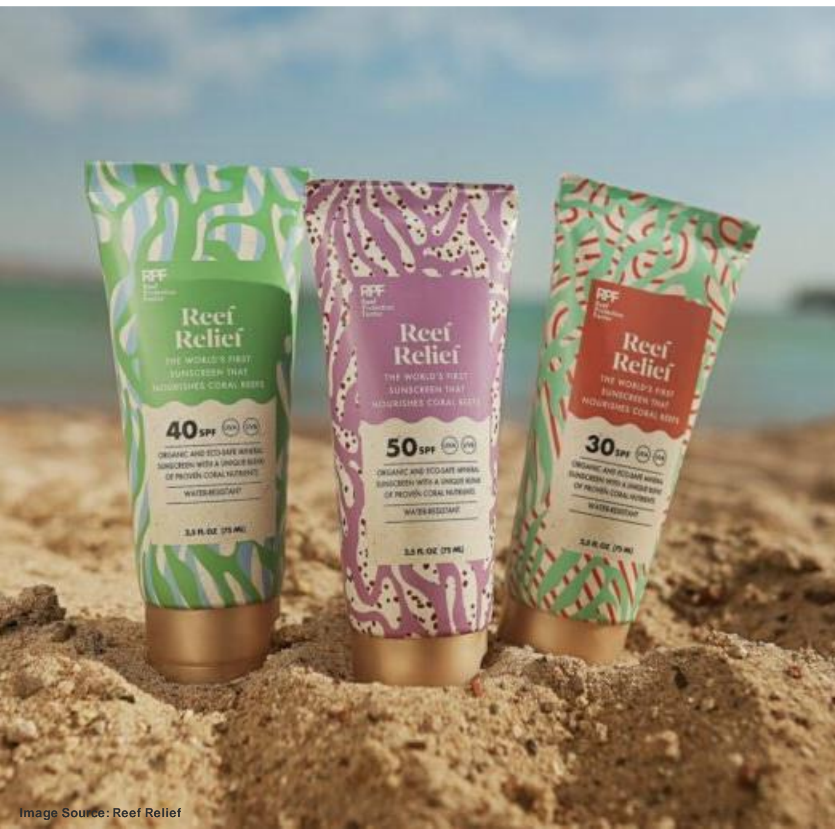
REEF RELIEF - ISRAEL The World's First Sunscreen That Nourishes Coral Reefs